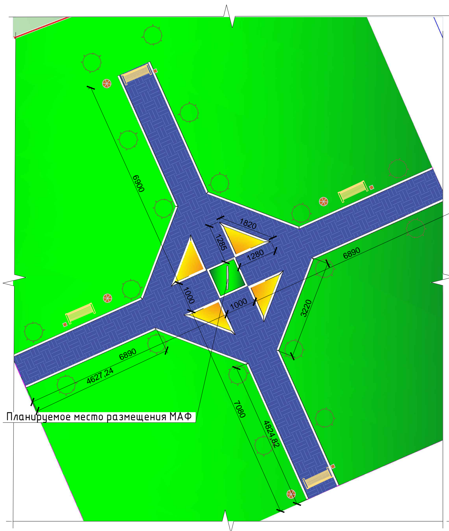
Схема планируемого расположения элементов благоустройства территории общего пользования (соседствующая территория с земельным участком сооружения памятника)